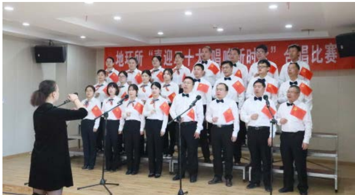
江西地环所“喜迎二十大”合唱比赛

为喜迎党的二十大胜利召开，倡导全所党员干部职工以更加昂扬的斗志和健康向上的精神风貌投入各项事业发展中去，近期，江西省地质调查勘察院地质环境监测所开展“喜迎党的二十大”系列主题活动。